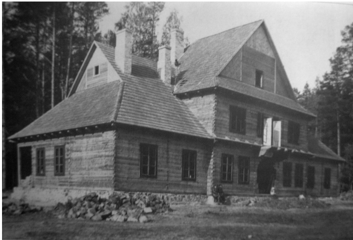
Рис. 5. Будинок дирекції і управління кар’єром. Фото 30-х рр. XX ст. [11]. Фото 1930-х рр. [11]

Як відомо, проблема виразності образу костюлів стала провідною в реалізації програми ідеологічного впливу на населення II Речі Посполитої. У періодичних виданнях перших повоєнних років і на початку 20-х минулого століття