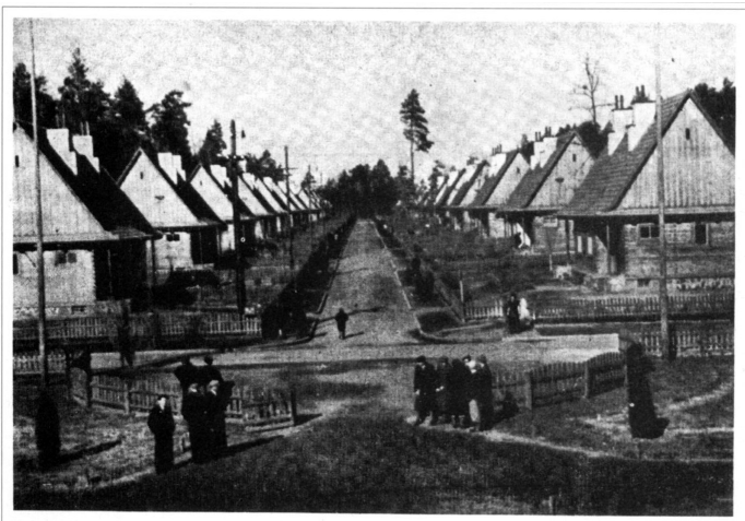
Рис. 2. Фрагмент забудови вулиці „В”. Фото 1938 р. [11].

У вирішенні генерального плану був чітко виражений новітній для свого часу підхід до просторової організації території, аналогічний, наприклад, розплануванню селищ Кіфхук у Голландії (1925-1930 рр. арх. П. Ауд) та Даммершток у Німеччині (1927-1928 рр., арх. В.Гропіус) [4, с.108, 110-112] зі строгим дотриманням принципу стрічкової забудови та застосований в архітектурі Фінляндії ландшафтний принцип [5, с. 12].